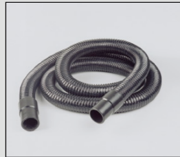
Slang lengte 2,5 m H 2,5/45; lengte 5 m H 5,0/45.