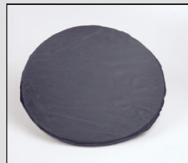
Actief koolfilter FAC HV voor het neutraliseren van geur.