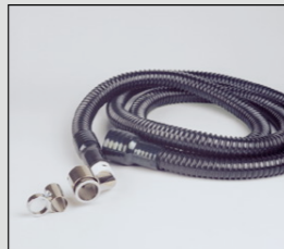
Opzetnozzles om een standaard lastoorts te voorzien van afzuiging; type NKT voor bovenafzuiging; type NKC voor ringafzuiging.