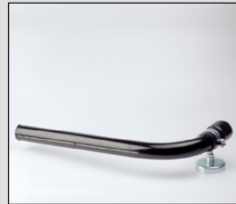
Afzuignozzle EN-40 geschikt voor elektrodes met een trek van max. 40 cm.