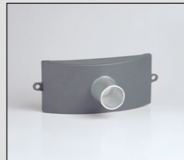
Slangansluiting HCH 45 voor de afvoer van gefiltreerde lasrook bijv. bij het lassen van rvs.